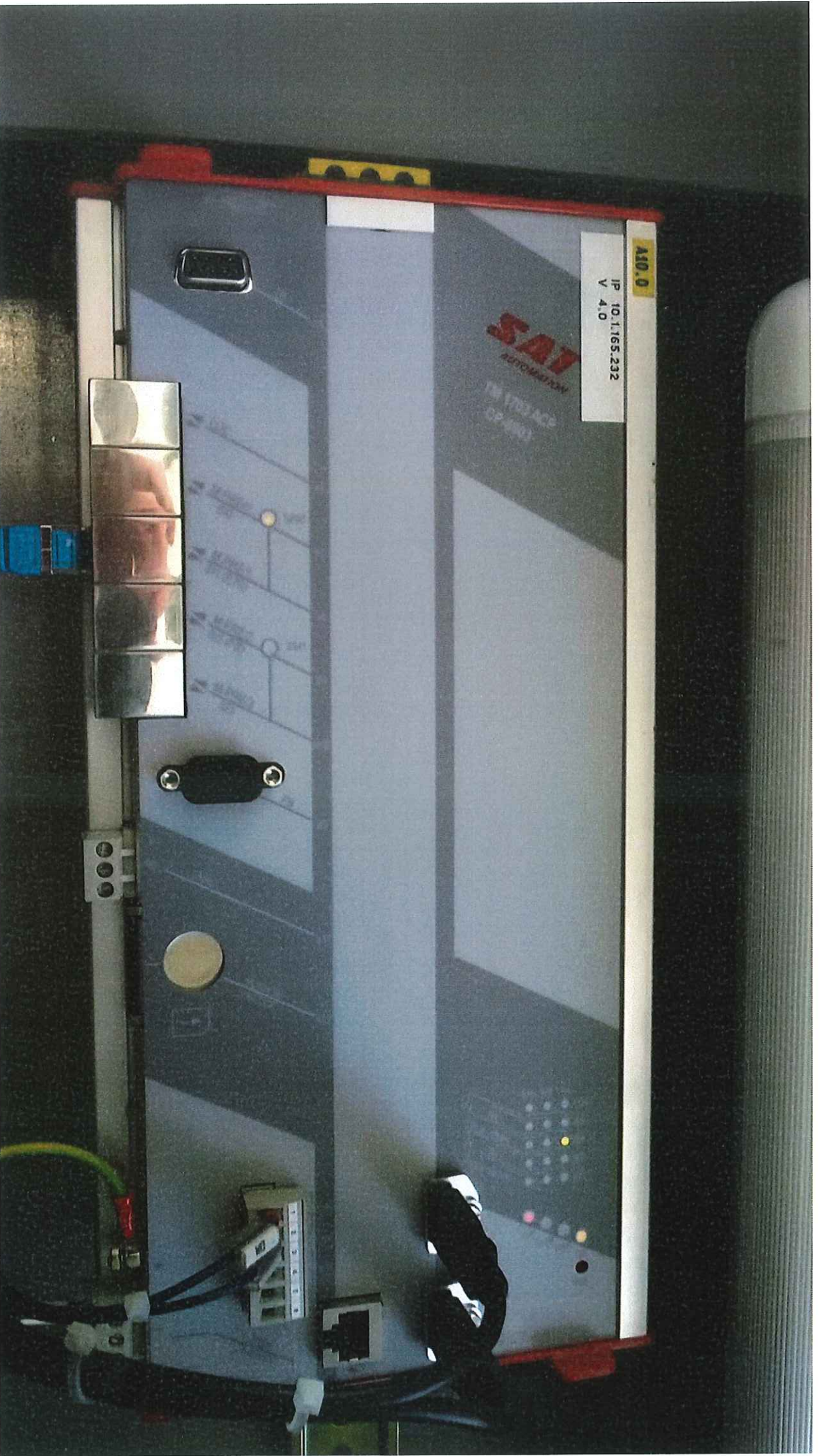
PONT ST. MARTIN - PLC Regolatore di Velocità Gruppo